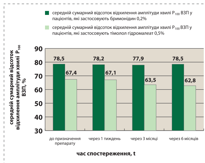
Рис. 3. Динаміка середнього сумарного відсотку відхилення амплітуди хвилі P 100 викликаних зорових потенціалів, %

За даними проведених викликаних зорових потенціалів у пацієнтів першої групи ми відмічали збереження відхилення амплітуди компоненти P100 ВЗП на рівні ( 78,6 \pm 2,76 ) % ( p > 0,05 ), у другій групі – зниження вказаного показника із 67,4 \pm 3,21 до (62,8 \pm 2,97) % ( p > 0,05 ), що у контексті із клінічною картиною та рядом інших проведених досліджень підтверджує наявність атрофії зорового нерва та порушення генерації нервового імпульсу (Рис.3).